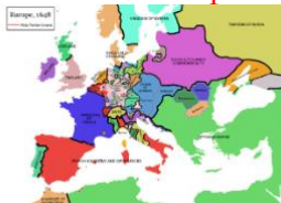
Bild: karta Europa 1648

Kungens uppskattning av Salvius resulterade i att han 1629 adlades: Johan Adler Salvius.