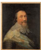
Bild: Axel Oxenstierna

Nu har Oxenstierna och Gustav II Adolf fått ögonen på Salvius och han utnämndes