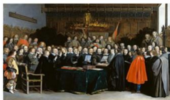
Bild: Fredsdelegaterna i Münster

Tilläggas skall att den av fredskongressen antagna exekutionsordningen i stora delar författats av Salvius.