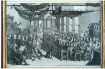
Bild Fredsbanketten i Nürnbergs rådhus 25 sept. 1649