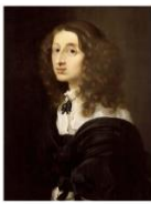
Bild Drottning Kristina